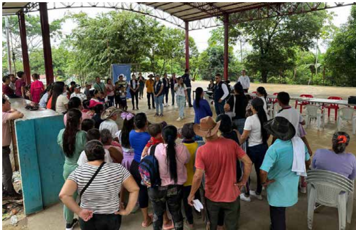
La comunidad de La Institución Educativa Rural de Orú Bajo en El Tarra, exigió de las autoridades garantías para los escolares.

Finalmente, el Gobierno hizo un exhorto directo a los grupos armados ilegales en el Catatumbo, Guaviare, Jamundí y otras regiones del país. Se les instó a mantener la escuela como un espacio sagrado para la vida y la convivencia, y a entablar diálogos de paz con el Gobierno colombiano. La finalidad es materializar en hechos concretos un alivio al sufrimiento de la población civil, en particular de niños, niñas, adolescentes, docentes, personal administrativo y padres de familia, garantizando que las comunidades educativas permanezcan completamente ajenas al conflicto.