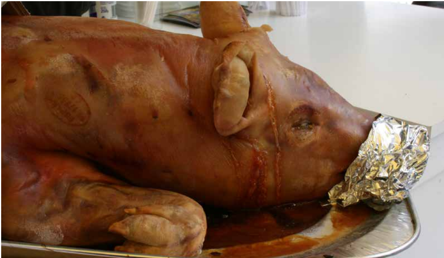
La lechona es un plato típico de la región del Tolima y Huila, aunque su preparación se ha extendido a Bogotá, Valle del Cauca y Cundinamarca.