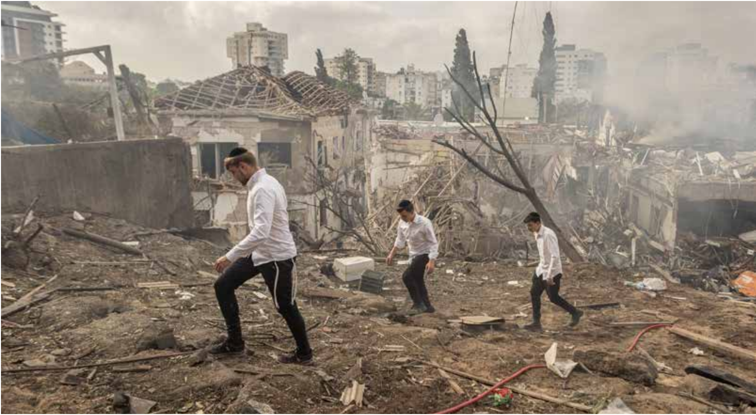
Tras los recientes bombardeos, tanto en Irán como en Israel, el desolador paisaje se reduce a ruinas. Las imágenes evidencian la devastación y el alto costo material del conflicto.

raelí, Benjamin Netanyahu, no ha descartado atacar directamente al líder supremo de Irán, Alí Jemeneí, comparándolo con Hitler y afirmando que su eliminación «no escalaría el conflicto, lo terminaría». • La comunidad internacional, incluyendo al Papa y al jefe de DDHH de la ONU, ha hecho llamados urgentes a la «responsabilidad y la razón» y al diálogo para evitar una escalada incontrolable. China ha condenado a Israel por «violar la soberanía» de Irán.