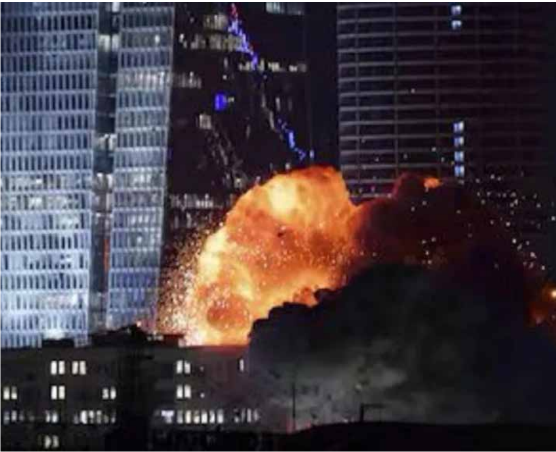
La tensión entre Israel e Irán ha alcanzado un punto crítico, con un intercambio sin precedentes de declaraciones y ataques directos que mantienen a la comunidad internacional en vilo.

Conflicto Enraizado Irán e Israel presentan argumentos basados en