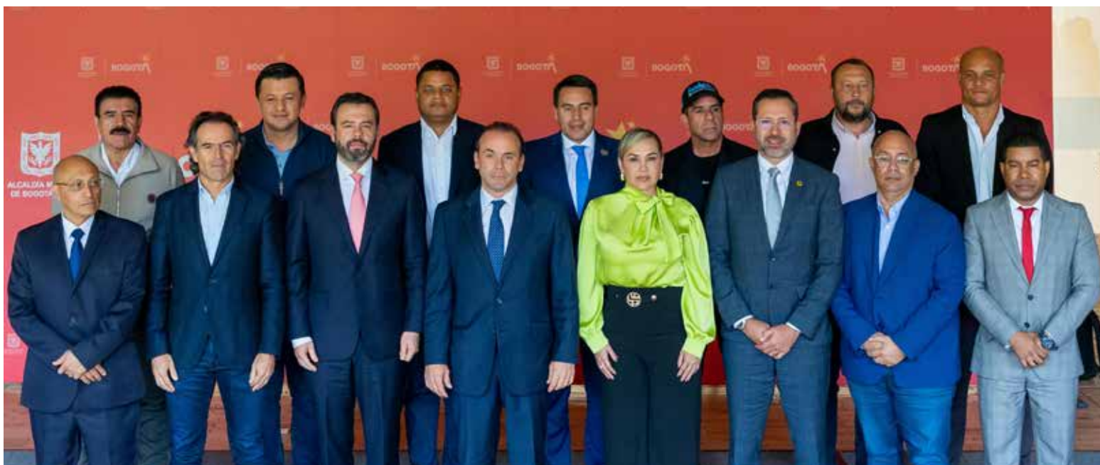
La reciente cumbre de alcaldes de capitales en Bogotá reveló una notable ausencia, con solo 15 de 32 mandatarios presentes. Esta baja asistencia, inferior al 50%, generó cuestionamientos sobre la representatividad de las deliberaciones.

Dentro de sus pronunciamientos, los alcaldes expresaron una profunda