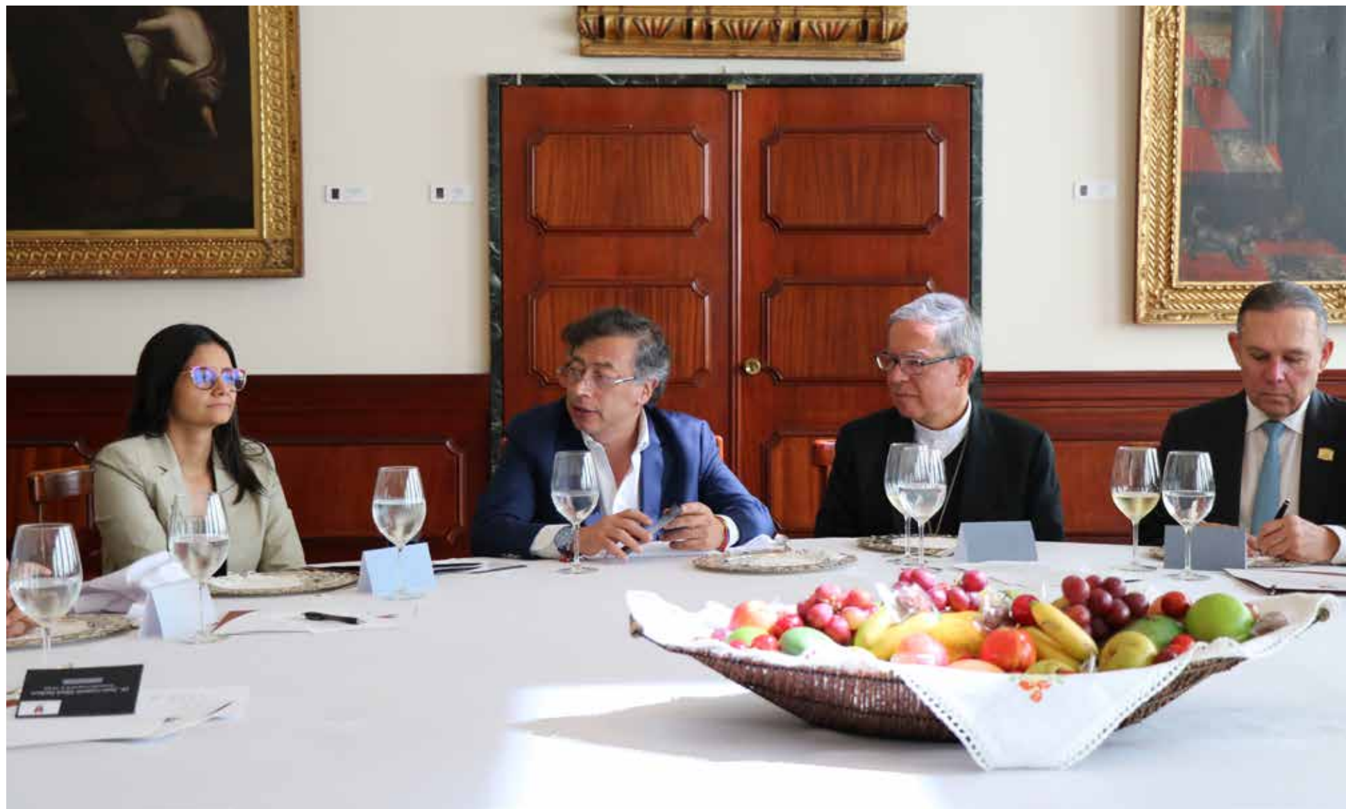
El encuentro multisectorial en la Casa Episcopal enfatiza un esfuerzo concertado por construir consensos y fomentar armonía en Colombia. Busca superar divisiones mediante el diálogo constructivo.