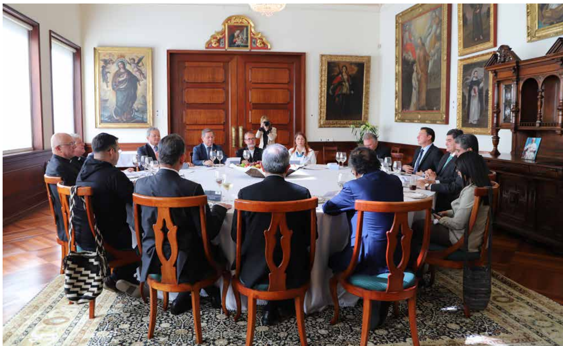
El encuentro contó con la participación de las cabezas de los organismos de control y la autoridad electoral, liderados por el procurador Gregorio Eljach Pacheco. Lo acompañaron el contralor Carlos Hernán Rodríguez, la defensora del Pueblo Iris Marín Ortiz, y el registrador Hernán Penagos Giraldo, subrayando el compromiso de estas entidades en el diálogo nacional.