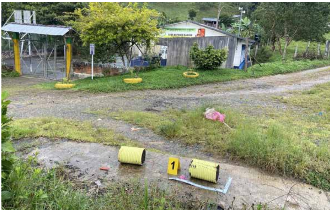
La Institución Educativa Rural de Orú Bajo en El Tarra fue gravemente afectada por artefactos explosivos, un hecho que el Gobierno nacional ha repudiado enérgicamente

El Ministerio reiteró con preocupación que la población civil, y de manera particular la infancia y la adolescencia, sigue sufriendo los peores efectos de la violencia. Estos impactos no solo trastocan sus trayectorias educativas, sino que minan sus posibilidades de desarrollo integral y el sentido de vida colectiva en sus territorios.