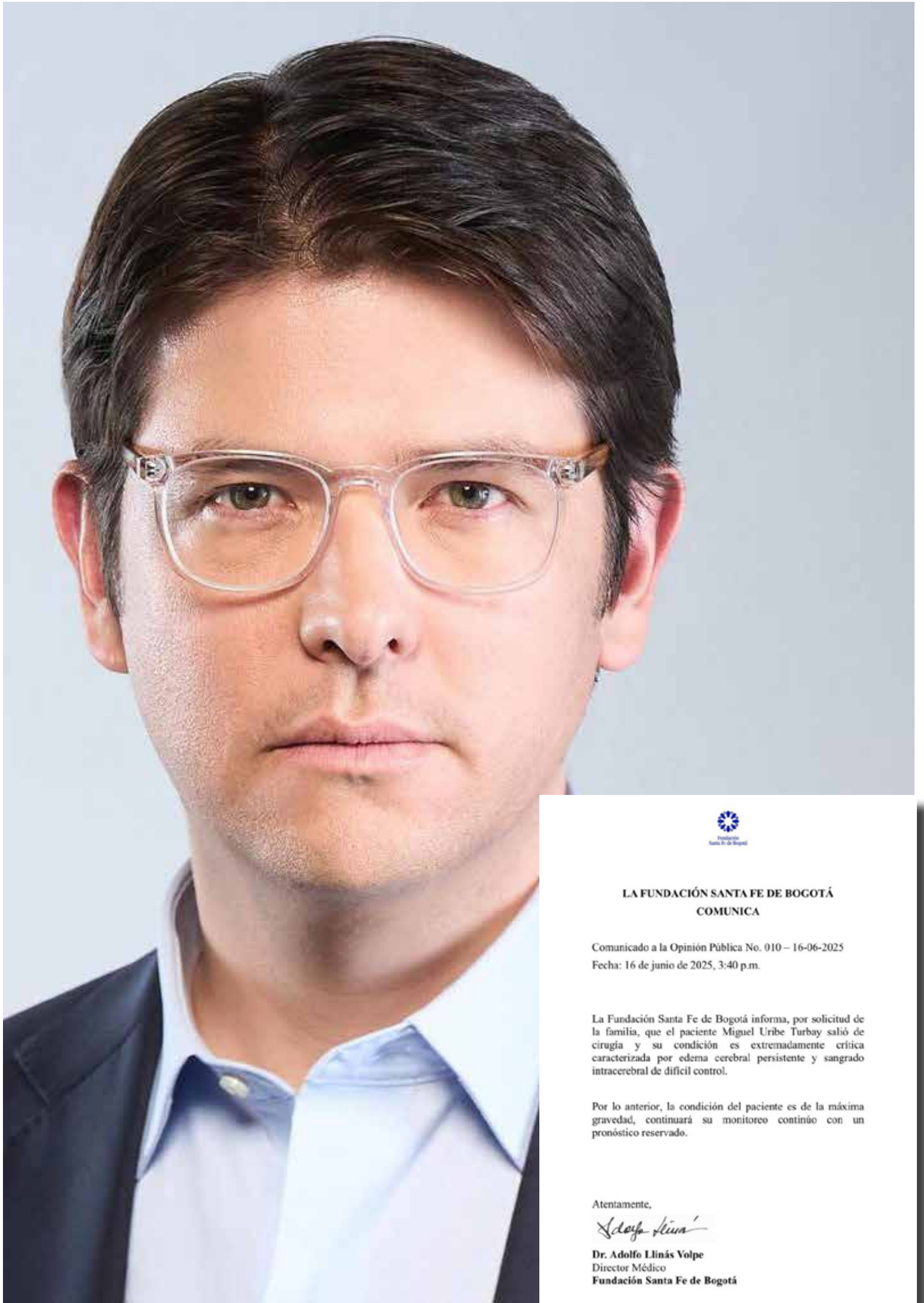
Miguel Uribe Turbay, senador de la República

La combinación de esta hinchazón cerebral con un sangrado interno que los médicos encuentran complejo de manejar crea un panorama médico sumamente inestable. El pronóstico, en estos casos, es calificado como reservado, lo que indica que la evolución de su estado es incierta y que el riesgo de complicaciones severas o un desenlace fatal permanece elevado. La esperanza se mantiene en los pequeños indicios de mejoría reportados, mientras el país sigue atento a cada parte médica.